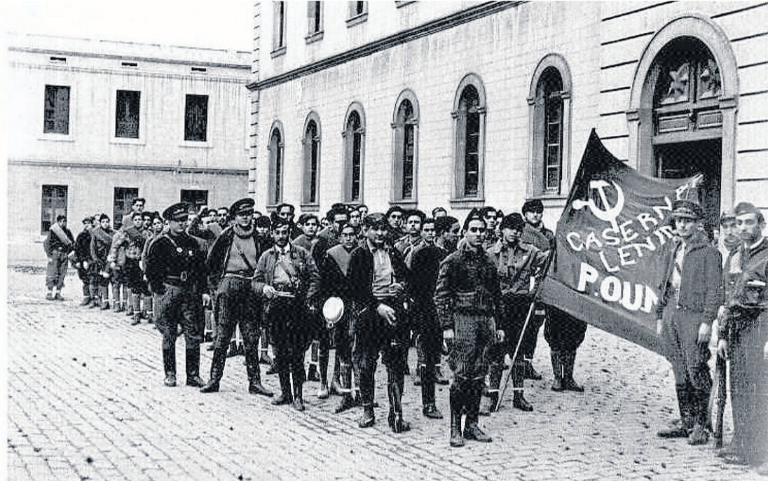
George Orwell, al fondo, el más alto de todos, en el cuartel Lenin.

Una de las cosas que más emoción me produce es la reivindicación