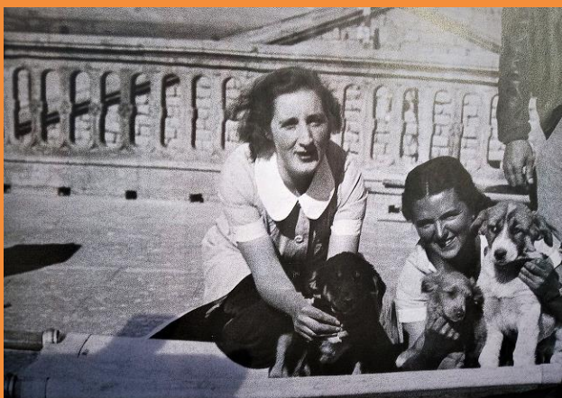
Enfermeras del hospital de Poleñino.