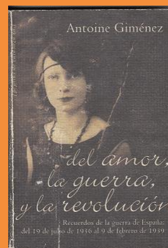
Libro de Antoine Gimenez donde relata la Batalla de Perdiguera.