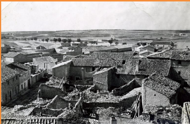
Bombardeo sobre Perdiguera.

El 15 y 16 de octubre de 1936 tuvo lugar la denominada Batalla de Perdiguera, donde, en el intento de toma de la localidad, perdieron la vida treinta y seis milicianos del Grupo Internacional de la Columna Durruti. La localidad de Perdiguera sufrió durante los primeros meses de la guerra una enorme represión contra su población civil.