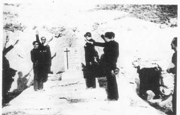
1) Los Dragones falangistas en la posición de San Simón (1937). 2) Comford combatió con el POUM en Lecifena (1936). 3) Serrano Súñer visita el monolito con la laureada en Alcubierre.

G eorge Orwell (1903-1950) fue un escritor muy comprometido con la lucha de clases, bajó a los fondos de la miseria, a las minas y cambió su pluma por un viejo máuser para combatir la plutocracia en España. Y además estuvo aquí, en tierras oscenses", dice el etnógrafo, médico y escritor Manuel Benito, que publica 'Orwell en las tierras de Aragón' (Trallero editor; 116 páginas). Agrega: "Decidí seguir su estela a través de sus escritos